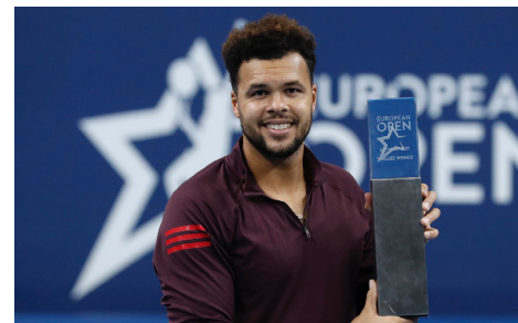
Vainqueur 2017 : Jo-Wilfried Tsonga