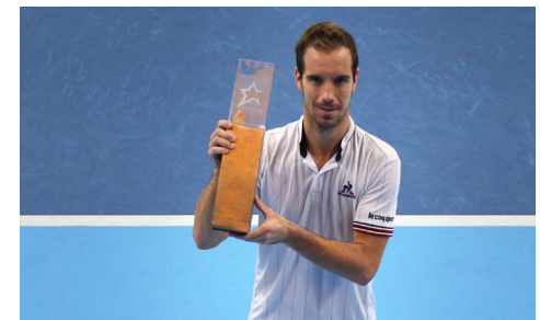
Vainqueur 2016 : Richard Gasquet

L' European Open est le plus grand et unique tournoi de tennis de ce niveau en Belgique. Le tournoi fait partie du circuit ATP . Des tournois de simples et de doubles messieurs sont organisés avec des joueurs de très haut niveau internationaux et belges.