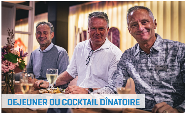
DEJEUNER OU COCKTAIL DÎNATOIRE