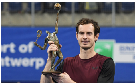
Vainqueur 2019 : Andy Murray