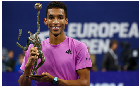
Vainqueur 2022 : Félix Auger-Aliassime