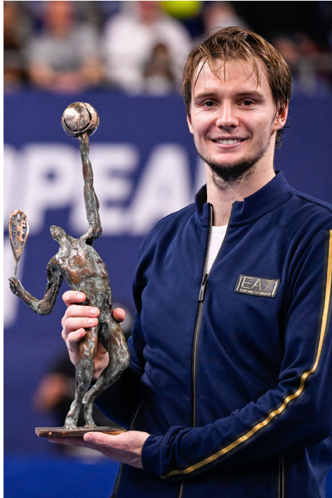
Vainqueur 2023 : Alexander Bublik