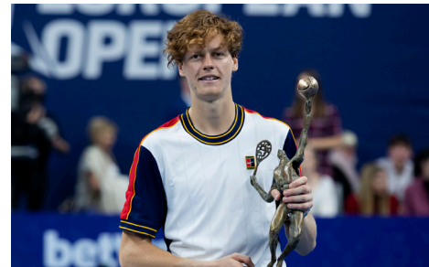
Vainqueur 2021 : Jannik Sinner