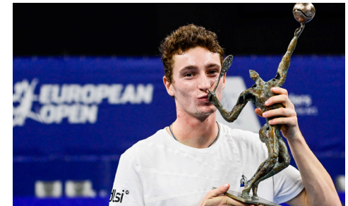
Vainqueur 2020 : Ugo Humbert