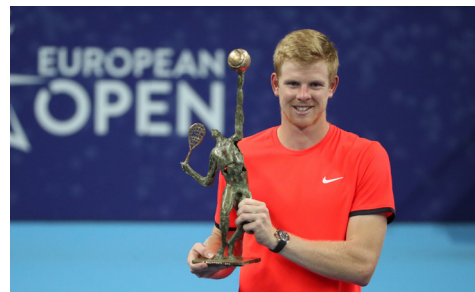
Vainqueur 2018 : Kyle Edmund