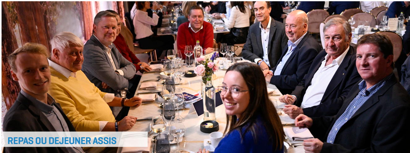
REPAS OU DEJEUNER ASSIS